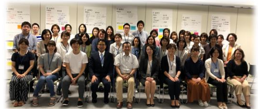
CDE滋賀フォローアップセミナーin甲賀

詳しくは、CDE滋賀ホームページまで ( http://www.cde滋賀.jp )